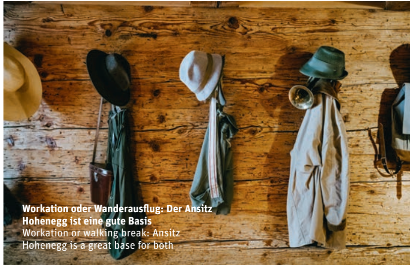
Workation oder Wanderausflug: Der Anstiz Hohenegg ist eine gute Basis Workation or walking break: Anstiz Hohenegg is a great base for both