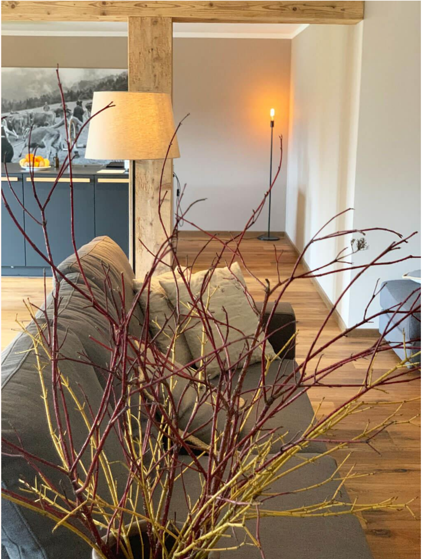
Weiter relaxen auf der XXL-Couch.