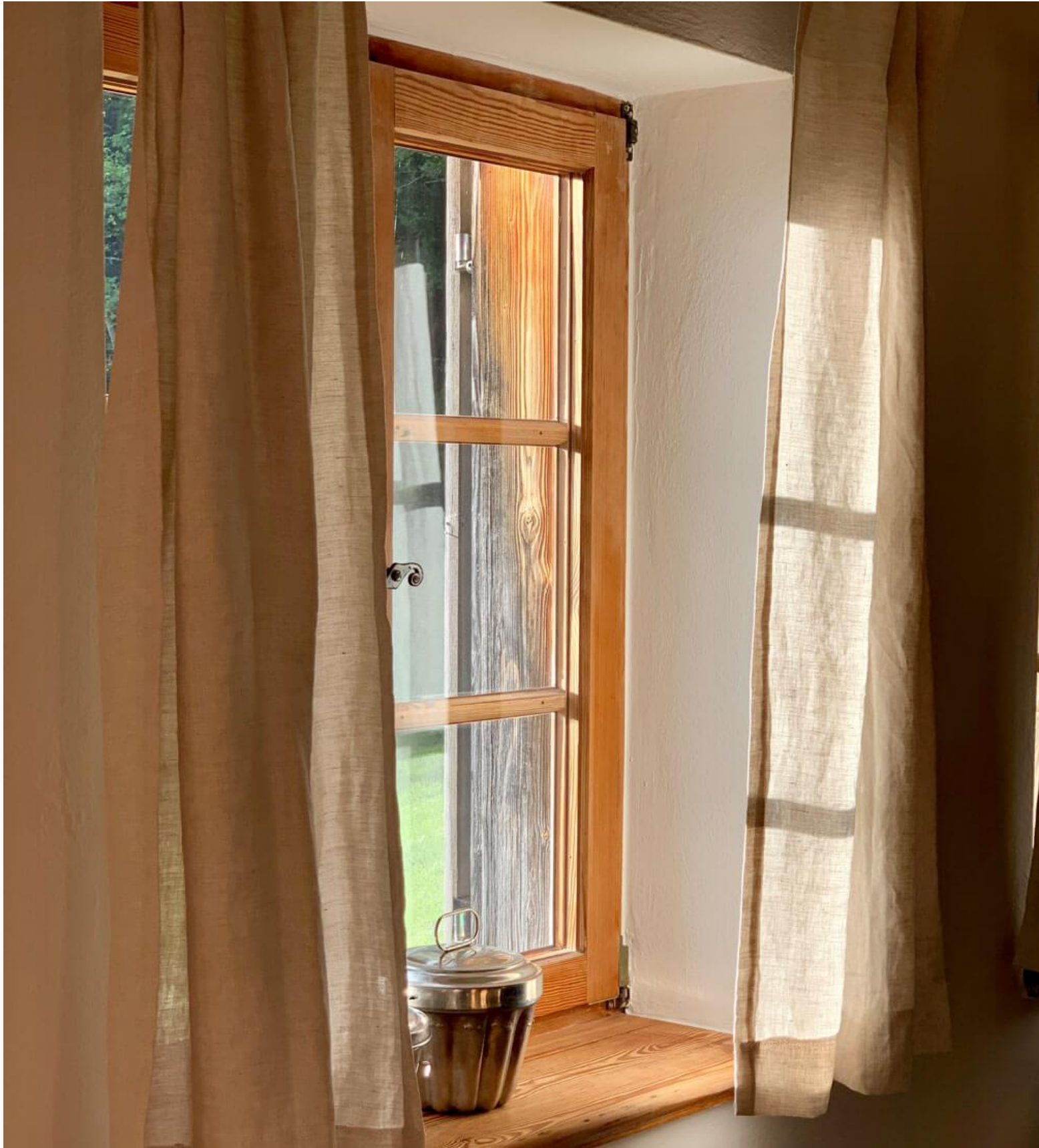
Der Blick in den Garten.