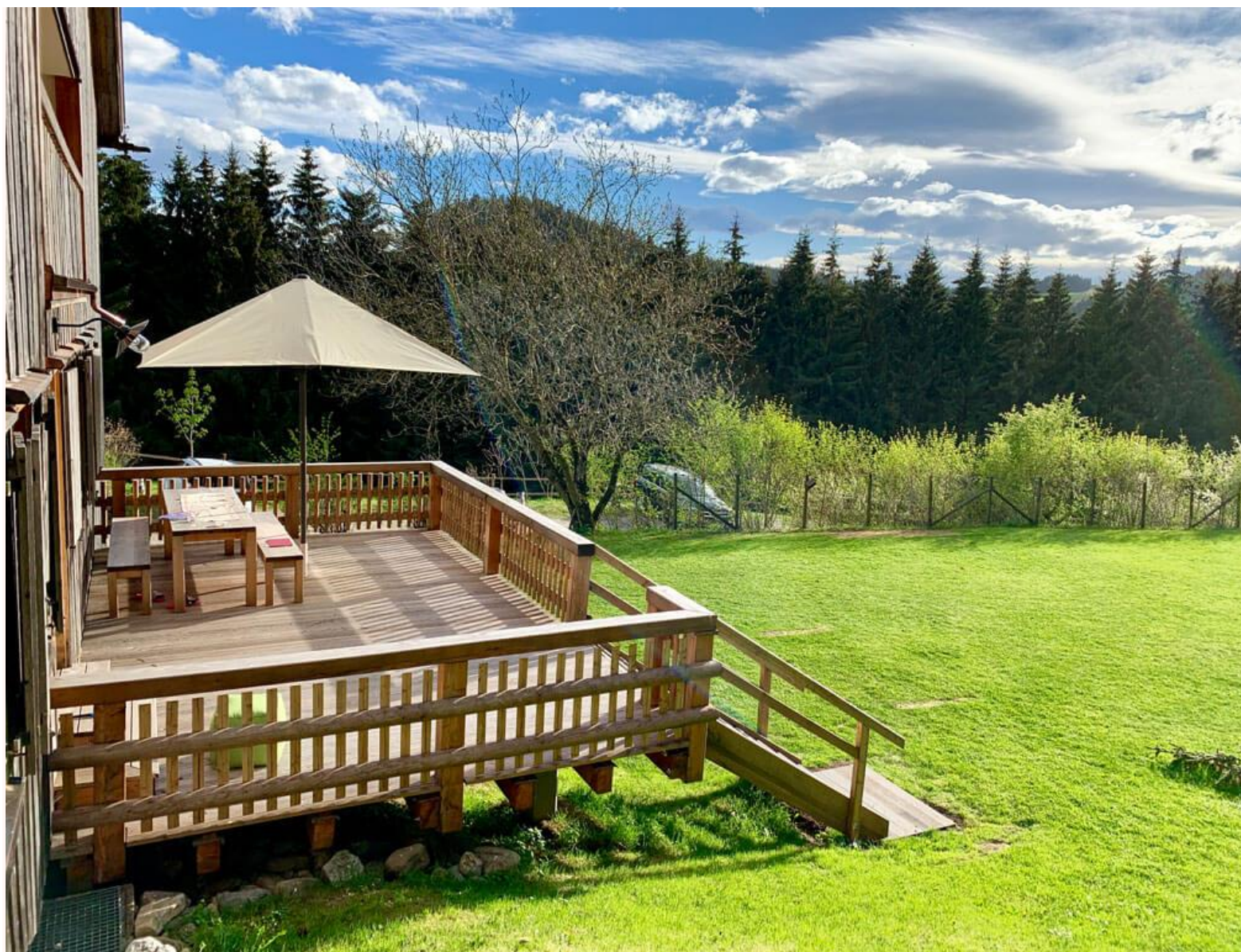
Über die Terrasse geht's in den Garten.