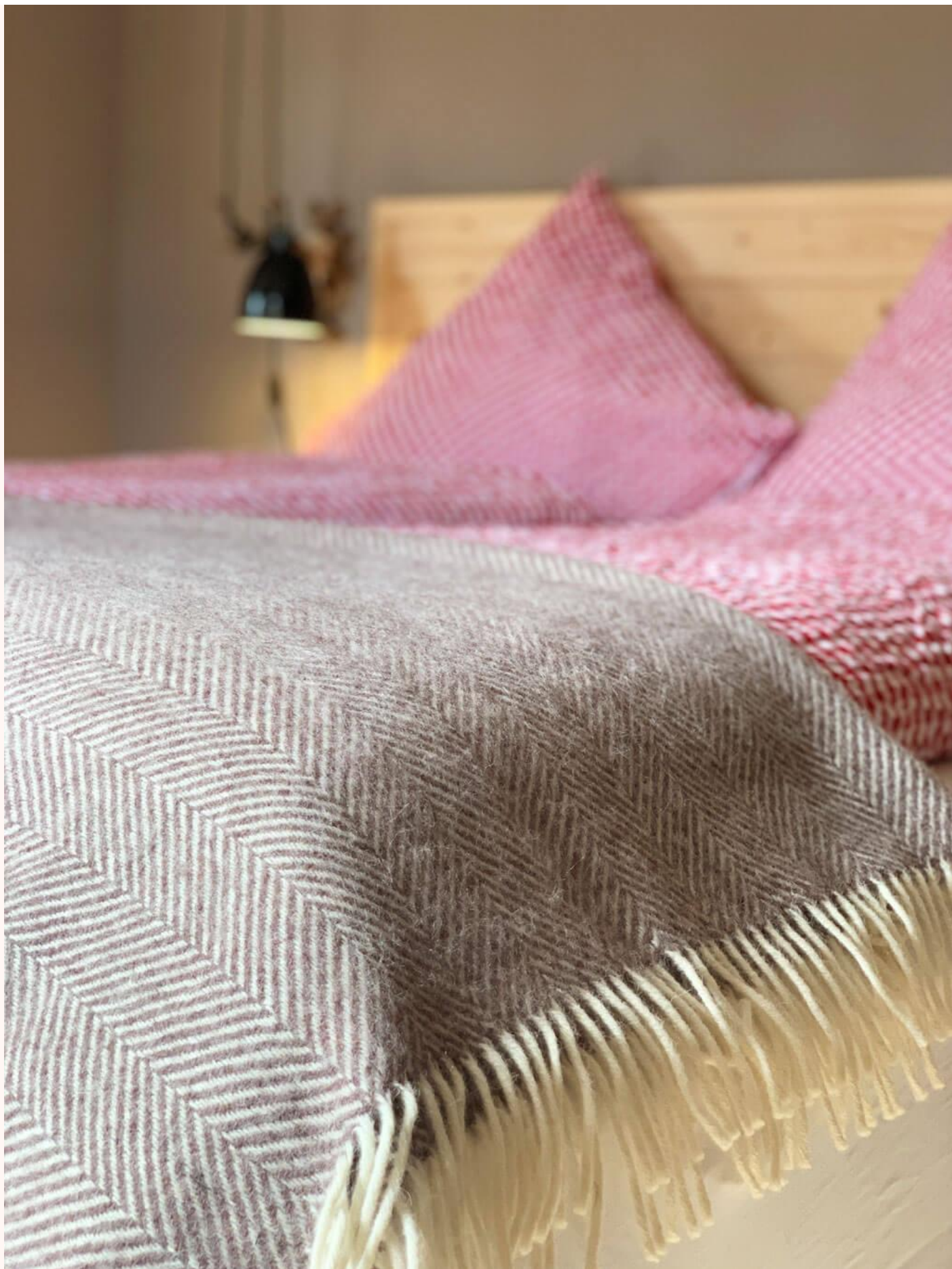
Schlafen im Himmel.