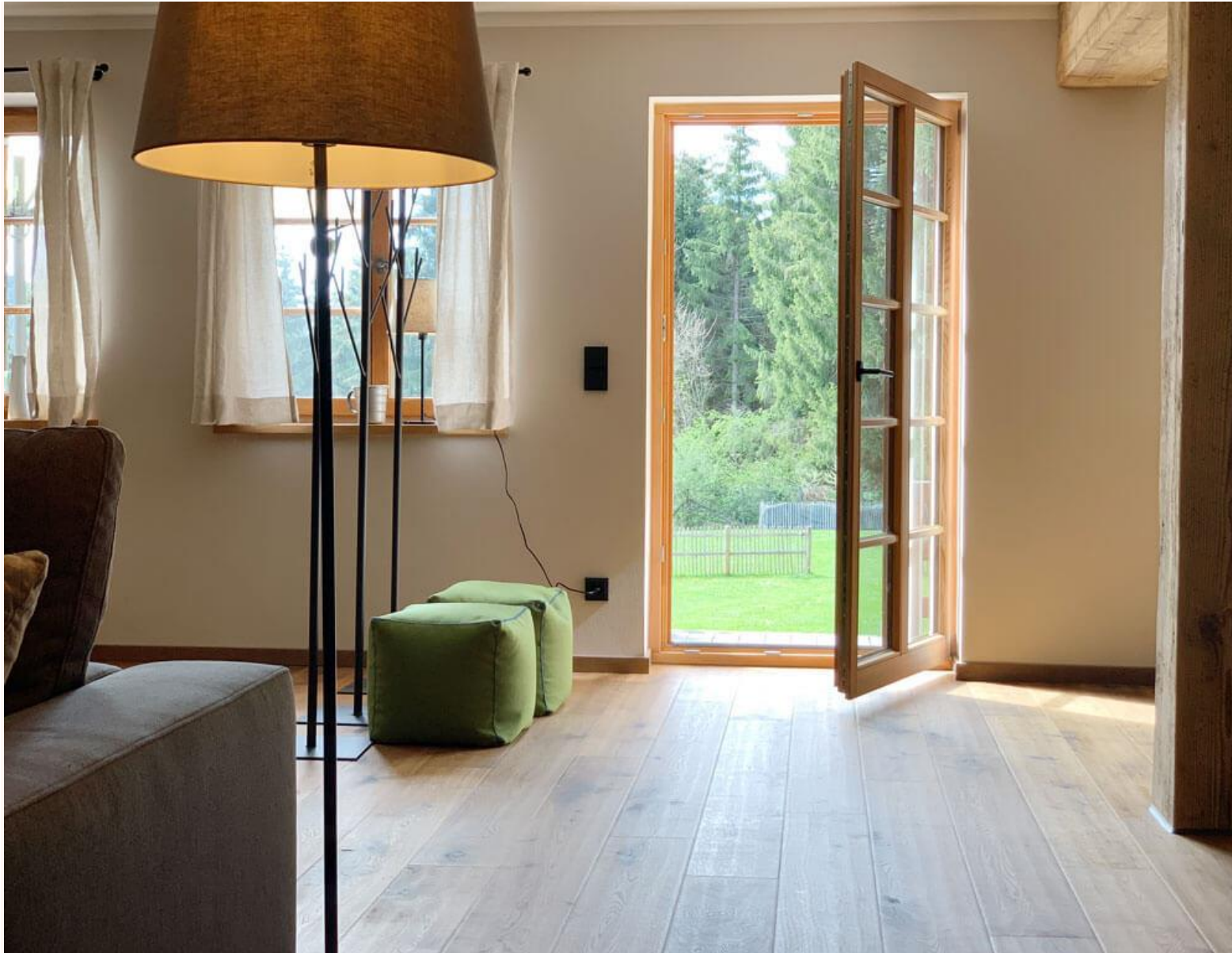
Die Tür zum grünen Paradies.