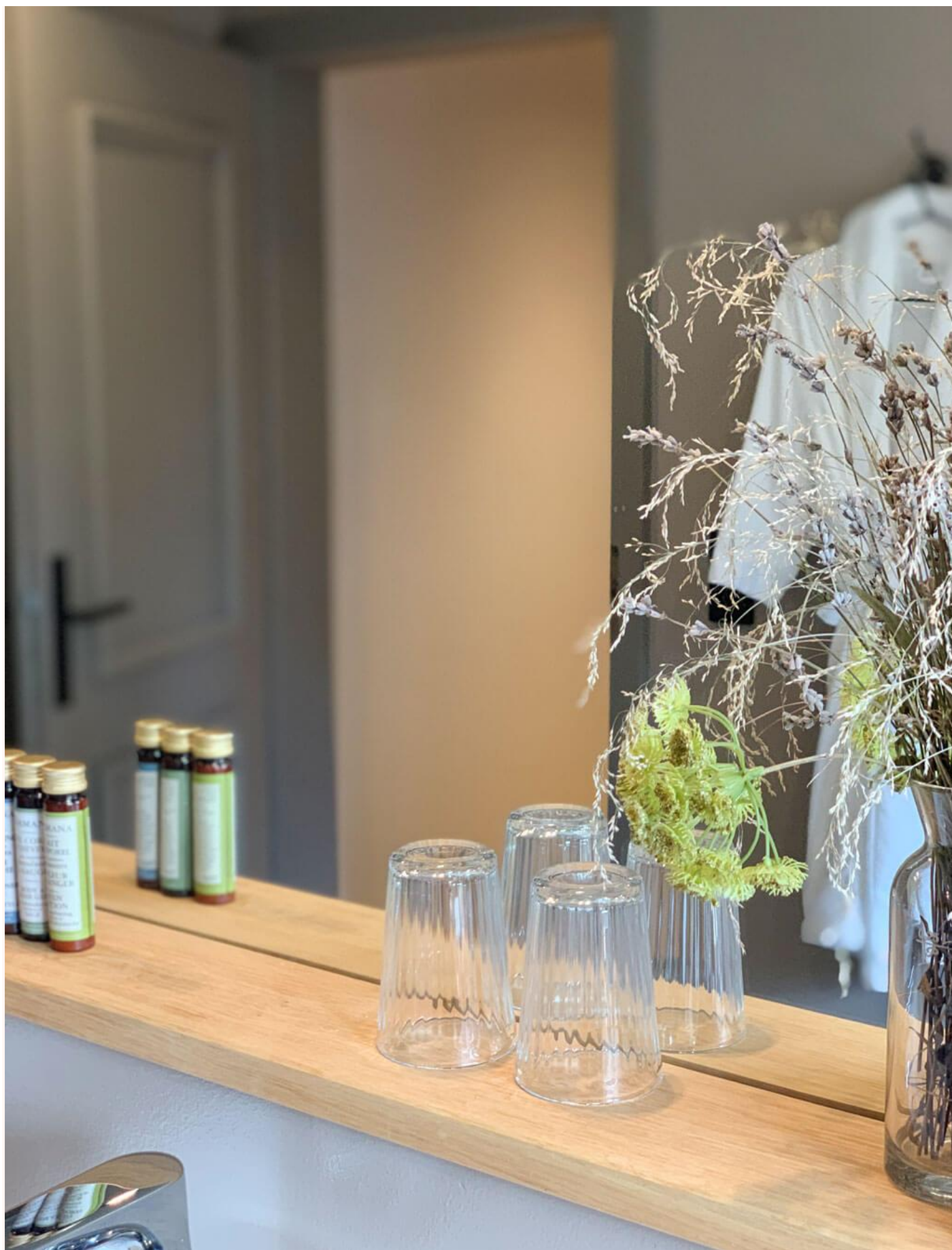
Das große Badezimmer Nummer eins wenige Schritte entfernt.