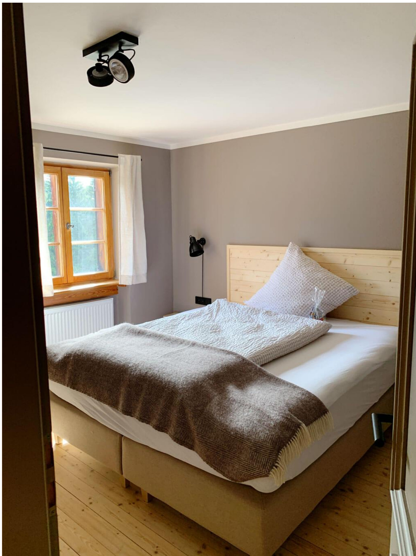
Das Kinderzimmer ist gleich nebenan.