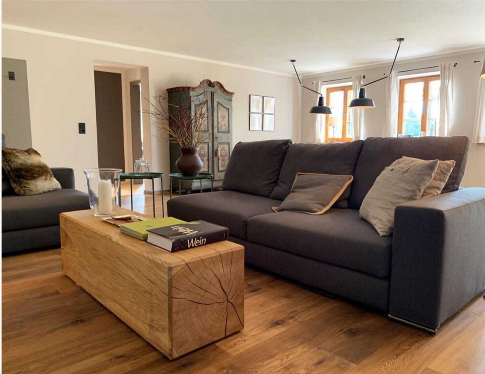
Relaxen auf der XXL-Couch.