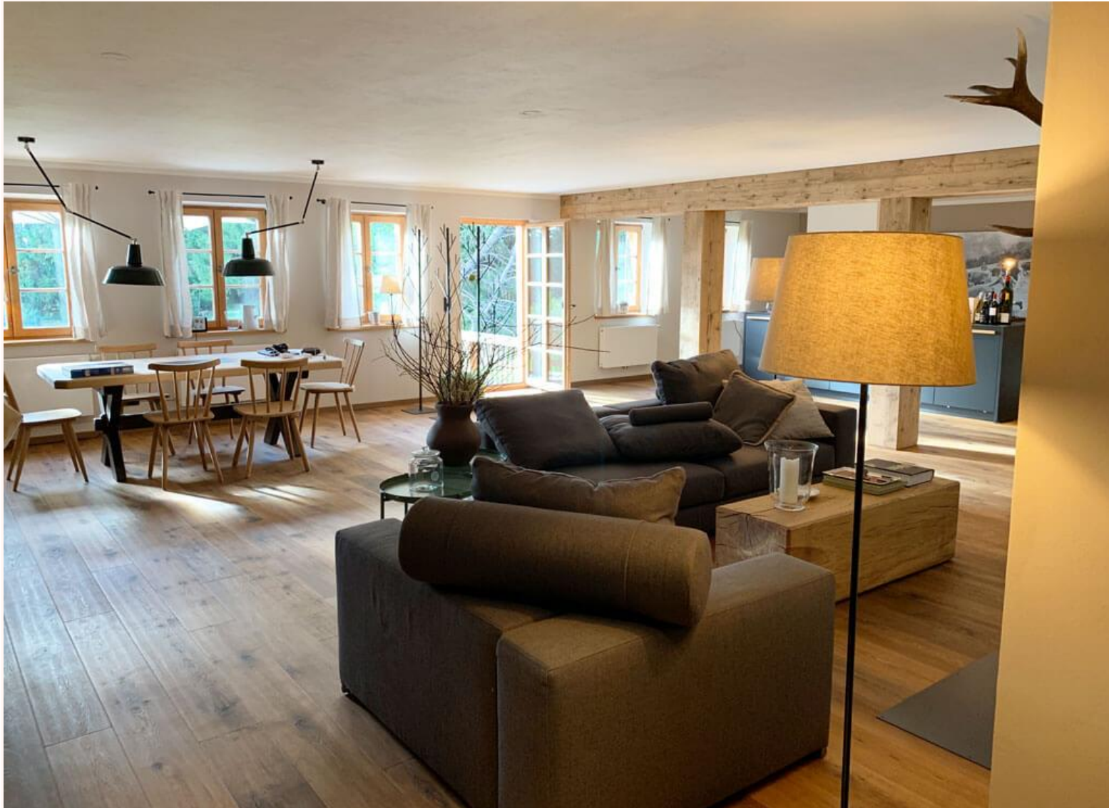
Wohnen und essen mit Stil.

Wir haben in der Stube Heuboden mit drei Schlafzimmern im Erdgeschoss gewohnt. Urgemütlich, très chic eingerichtet und wunschlos ausgestattet. Es gibt ALLES, angefangen vom Milchaufschäumer, über die Espressomaschine bis zur großen Pfanne und einem Toaster. Mein persönlicher Hit ist die Traumterrasse mit Gartenzugang. Seht selbst: