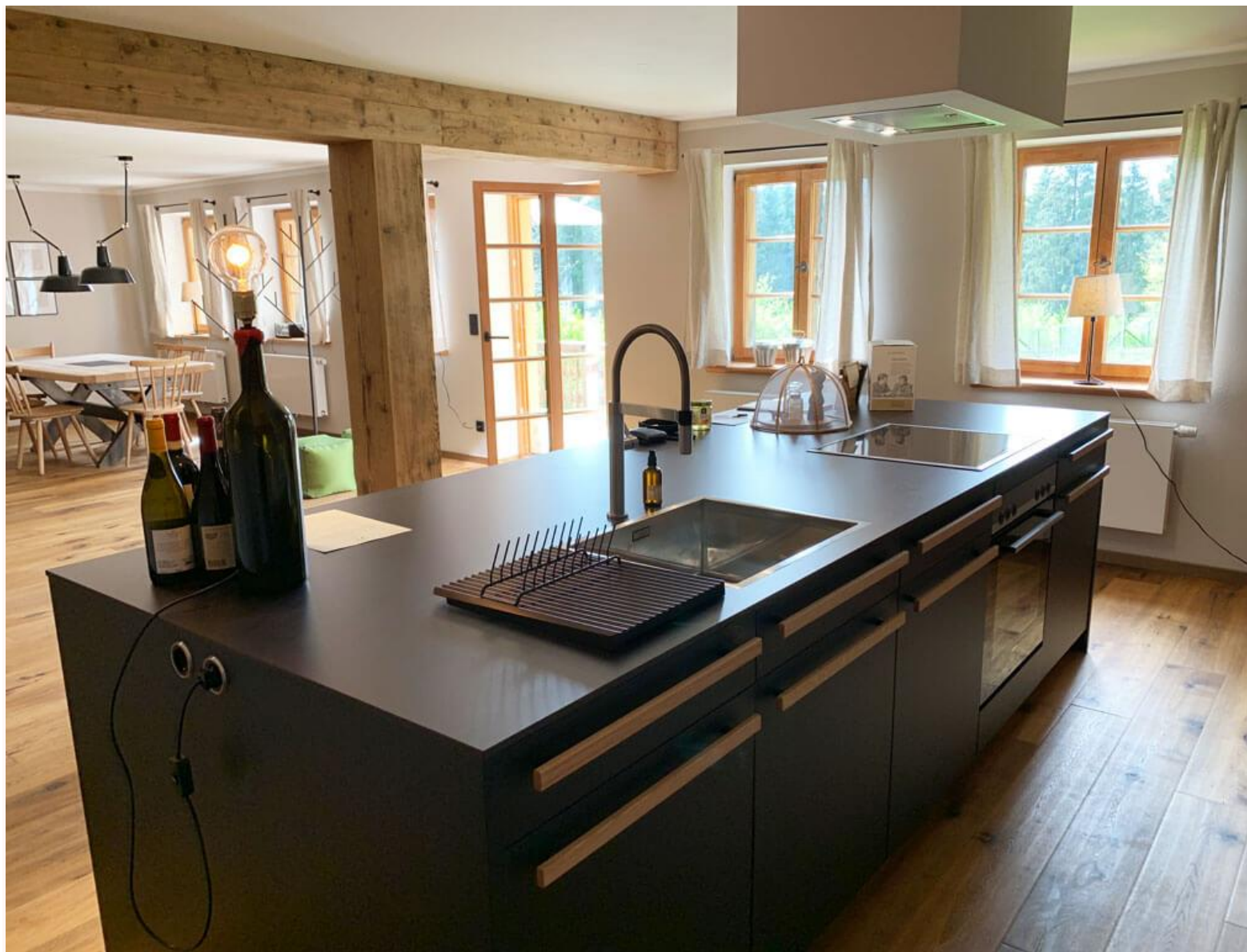
An der Kochinsel macht sogar Kochen im Urlaub Spaß!