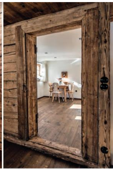
Kamin und Holz sorgen für heimelige Wärme im Schindelhaus.

und ausgesprochen gemütlich. Die Stuben in der Remise (60 – 140 qm) tragen so entschleunigende Namen wie „Waldblick“, „Heuboden“ oder „Wipfelglück“ und bieten zwei bis sechs Personen ein wunderbares Zuhause auf Zeit. Alle verfügen über eine voll ausgestattete Küche, Gmundner Geschirr, große Wohnbereiche, moderne Bäder, Schlafräume mit luxuriösen Boxspringbetten, Terrasse oder Balkon – außer Wipfelglück im Dachgeschoss. Im Freien steht ein Grillplatz zur Verfügung, darüber hinaus gibt es einen zentralen Sauna- und Ruhebereich. Kleine Gäste finden im sogenannten Schuhstall Kinderspielzeug vom Kettcar bis zum Cricketspiel sowie am Ende der Lichtung ein Fuß-