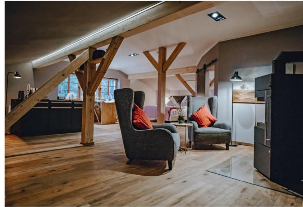
Das Wipfelglück ist ein romantischer Rückzugsort für traute Zweisamkeit.

ballfeld. Herzstück, Ursprung und Wohn-Highlight auf dem Anitz Hohenegg ist das Schindelhaus – 290 qm Wohnfläche, Platz für acht Gäste. Urige Gemütlichkeit in „d’Kucha“ mit niedrigen Decken und alten Holzstrickwänden trifft auf moderne Architektur im Wohnzimmer mit dem freigelegten Dachstuhl. Atemberaubend: der Ausblick durch die verglaste Loggia. Drei Schlafzimmer mit hochwertigen Boxspringbetten und Taschenfederkernmatratzen sorgen für erholsamen Schlaf, wobei hier lediglich das Zwitschern der Vögel die Nachtruhe „stören“ könnte. Mit selbst gesuchten Wildkräutern, Pilzen und Beeren aus den nahen Wäldern zaubern Hobbyköche das Abendessen. Zur Ausstattung des Schindelhauses gehören u.a. zwei Kamine. Sie sorgen an kalten Tagen für eine wunderbar wohlige Atmosphäre. Dazu ein gutes Buch, ein heißer Kakao oder ein Glas Rotwein – Herz, was begehrt du mehr?! Zu jeder Jahreszeit laden Wander- und Mountainbike-Wege zum Erkunden der Landschaft ein. Im Winter können die Ski direkt vor dem Haus angeschnallt werden und Lindau am Bodensee liegt nur 35 km entfernt. Restaurant- und Ausflugstipps, Wanderkarten mit Routenempfehlungen und Rucksäcke liegen für die Gäste bereit. ■