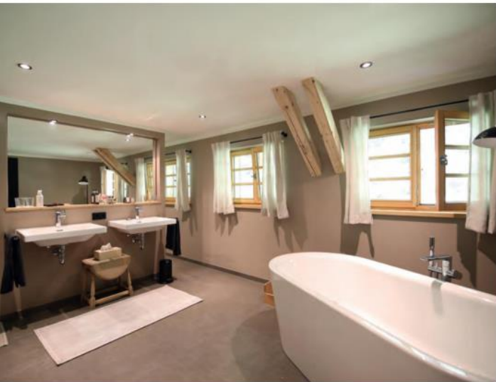
Masterbad mit zwei Waschbecken, Regendusche und frei stehender Badewanne im Schindelhaus.

und ausgesprochen gemütlich. Die Stuben in der Remise (60 – 140 qm) tragen so entschleunigende Namen wie „Waldblick“, „Heuboden“ oder „Wipfelglück“ und bieten zwei bis sechs Personen ein wunderbares Zuhause auf Zeit. Alle verfügen über eine voll ausgestattete Küche, Gmundner Geschirr, große Wohnbereiche, moderne Bäder, Schlafräume mit luxuriösen Boxspringbetten, Terrasse oder Balkon – außer Wipfelglück im Dachgeschoss. Im Freien steht ein Grillplatz zur Verfügung, darüber hinaus gibt es einen zentralen Sauna- und Ruhebereich. Kleine Gäste finden im sogenannten Schuhstall Kinderspielzeug vom Kettcar bis zum Cricketspiel sowie am Ende der Lichtung ein Fuß-